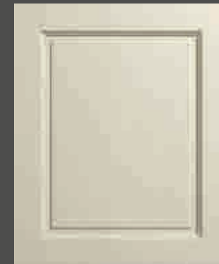
LACCATO PORO APERTO FRASSINO AVORIO