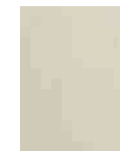
PORO APERTO FRASSINO AVORIO