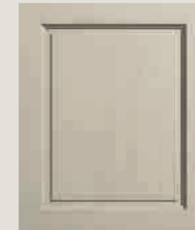
LACCATO PORO APERTO CORDA