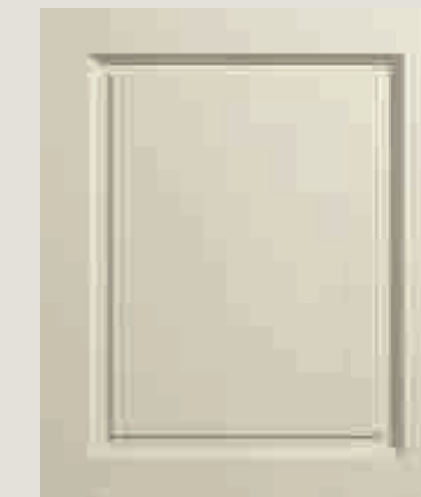
LACCATO PORO APERTO FRASSINO AVORIO