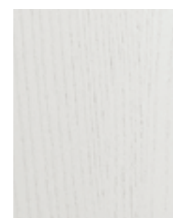
PORO APERTO BIANCO